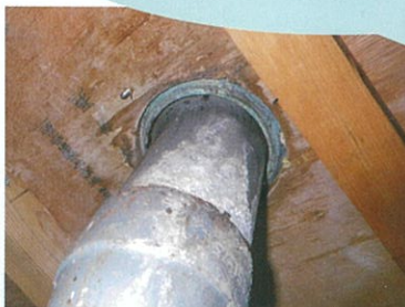
キッチンの水漏れ